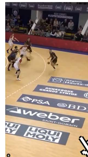
Clipping live (utilisation image du broadcast) → Replay de l'atelier concernant le clipping