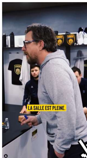
Inside vidéo (vestiaires, animations...)